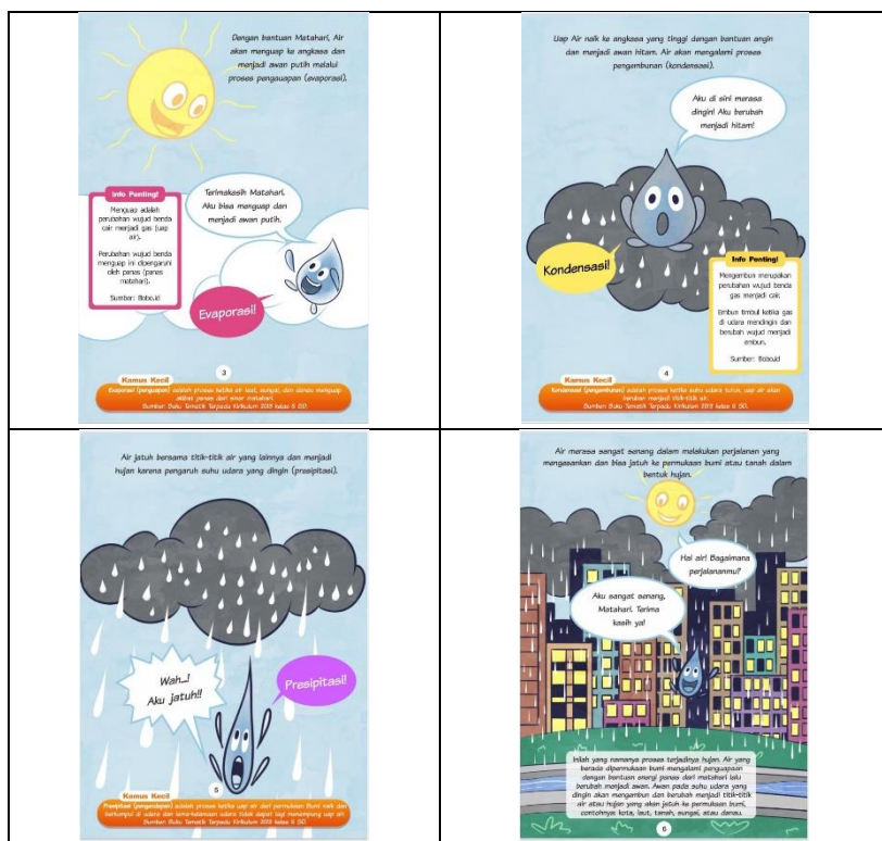
Gambar 2. Materi Proses Terjadinya Hujan