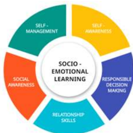
Gambar 1. Diagram Social Emotional Learning (SEL)(Hanik, E. U., & Ahsani, 2021)

Temuan tersebut sesuai dengan Perkembangan sosial-emosional anak dan selaras dengan indikator perkembangan yang telah dikemukakan (Athfal, 2021), yakni kesadaran diri, tanggung jawab atas diri sendiri dan orang lain, perilaku prososial. Temuan lapangan menunjukkan bahwa kebiasaan memberi salam dan bersikap santun mencerminkan berkembangnya social awareness dan relationship skills, sedangkan pembiasaan religius melalui doa dan refleksi nilai berkontribusi terhadap penguatan self-awareness dan responsible decision-making. Hal yang sejalan pada teori pembelajaran sosial (Zubaedi, 2024) memfokuskan utamanya keteladanan dan pembiasaan sebagai sarana internalisasi nilai moral dan sosial.