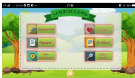
Gambar 3 : "HOME"