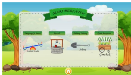
Gambar 5 : Menu Latihan