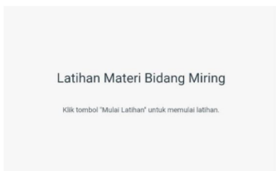
Gambar 6 : Latihan Bidang Miring