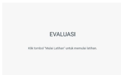
Gambar 7 : Menu Latihan

Manfaat dari aplikasi SiMach Land pada pembelajaran salah satunya merupakan upaya penyelesaian masalah yang dihadapi oleh pendidik pada masa pandemi COVID-19 dan masa transisi dalam kegiatan PJJ. Menurut (Asmuni, 2020) ada beberapa permasalahan dan penjel 2 an mengapa pembelajaran tatap muka jauh\nJurnal Basicedu Vol x No x Bulan x Tahun x\np-ISSN 2580-3735 e-ISSN 2580-1147