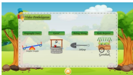
Gambar 4 : Menu Video Pembelajaran