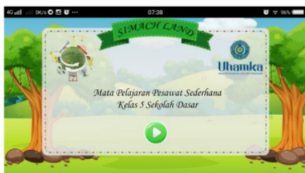
Gambar 2 : "WELCOME"

Produk akhir yang dihasilkan dari penelitian (R&D) ini merupakan sebuah media pembelajaran berbentuk aplikasi dengan nama "SiMach Land" yang dapat diakses diperangkat keras handphone pintar berbasis Android. Android merupakan sistem operasi yang dewasa ini memiliki peminat yang cukup besar di kalangan masyarakat, karena sistem ini bersifat open source atau sumber terbuka dimana masyarakat bisa dengan leluasa untuk bekerja sama hanya dengan menggunakan sumber kode dan internet (Dian Anggraeni & Kustijono, 2013). Media ini dilengkapi dengan Kompetensi, Materi yang lengkap dengan contohnya, Video Pembelajaran, Latihan untuk setiap sub-bab materi dan Evaluasi. Media pembelajaran ini dapat diakses dan diinstall melalui aplikasi Whatsapp sehingga dapat memudahkan proses transfer file aplikasi. Berikut dibawah ini pada gambar 2 s.d. 7, merupakan tampilan dari aplikasi media "SiMach Land":