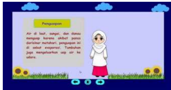
Gambar 8. Penjelasan Pengertian Penguapan, Pengendapan dan Pengembunan

Pada bagian ini diawali dengan teks penjelasan mengenai penguapan, lalu munculnya animasi seorang guru yang menjelaskan teks tersebut, kemudian disusul secara bergantian menuju teks pengendapan ke pengembunan.