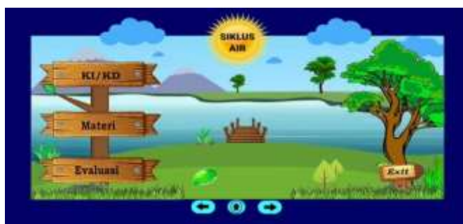
Gambar 3. Pembuka

Adapun visualisasi dari hasil revisi pembuatan media pembelajaran berbasis video interaktif yang dilakukan peneliti, dengan menggunakan software Adobe Plash CS5 dan aplikasi Kinemaster , yaitu: