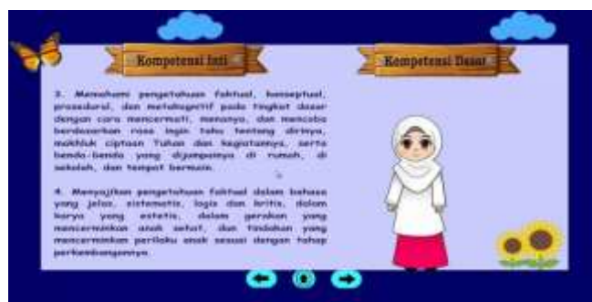
Gambar 4. Penyampaian KI,KD, Indikator dan Tujuan

Bagian pembuka pada media pembelajaran berbasis video ini dibuat menggunakan software Adobe Plash CS5 dengan dibantu aplikasi Kinemaster untuk menambahkan efek backsound dan dubbing isi, serta penyempurnaan gambar dan animasi. Pembuka ini diawali dengan suara dubbing pengembang dengan menanyakan kabar, dan menjelaskan materi yang akan dipelajari dilengkapi dengan animasi awan, matahari, dan kupu-kupu yang bergerak sehingga dapat menarik perhatian siswa.