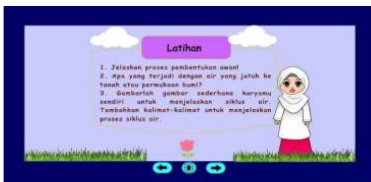
Gambar 12. Penjelasan Evaluasi Materi

Pada bagian ini diawali dengan animasi seorang guru kemudian muncul gambar tanah dan sumur lalu menjelaskan air tanah dan air sumur yang meresap setelah turun hujan, secara bergantian dilanjutkan dengan teks kesimpulan berwarna biru, lalu berganti disusul munculnya tiga siklus panah merah dengan teks.