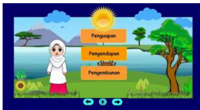
Gambar 7. Penjelasan Tahap-Tahap Siklus Air

Pada bagian ini muncul animasi seorang guru dengan diawali bertanya mengapa air tidak pernah habis, serta menjabarkan apa itu siklus air. Kemudian disusul munculnya tiga panah merah bersiklus.