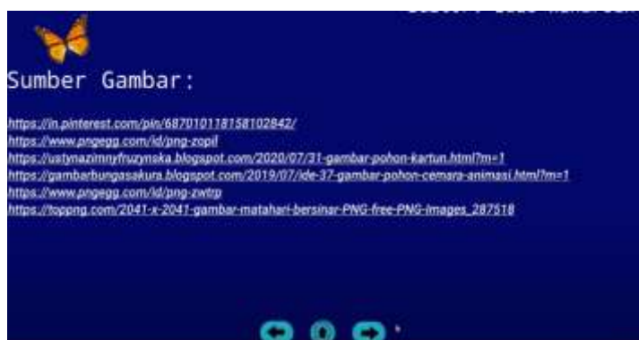
Gambar 13. Penutup (Sumber-Gambar)

Pada bagian ini muncul animasi seorang guru, dan menjelaskan latihan soal yang harus diisi oleh siswa, serta membacakan teks latihan soal kemudian kembali ke menu utama, layar pertama kemudian menutup pelajaran dengan harapan pembelajaran kali ini dapat bermanfaat bagi siswa.