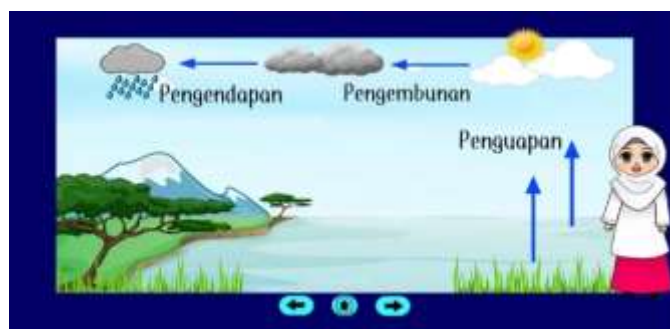
Gambar 9. Penjelasan Proses Siklus Air

Pada bagian ini diawali dengan teks penjelasan mengenai penguapan, lalu munculnya animasi seorang guru yang menjelaskan teks tersebut, kemudian disusul secara bergantian menuju teks pengendapan ke pengembunan.