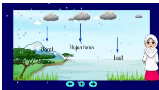
Gambar 10. Penjelasan Proses Hujan

Pada bagian ini diawali dengan munculnya animasi seorang guru lalu menjelaskan gambaran dari proses siklus air dengan sistematis, diawali dengan munculnya tanda panah biru ke atas, lalu awan putih dan teks penguapan, kemudian dilanjutkan panah biru ke samping kemudian muncul awan berwarna abu-abu dan teks pengembunan, kemudian muncul kembali panah biru ke samping disusul awan ber hujan dengan teks pengendapan.