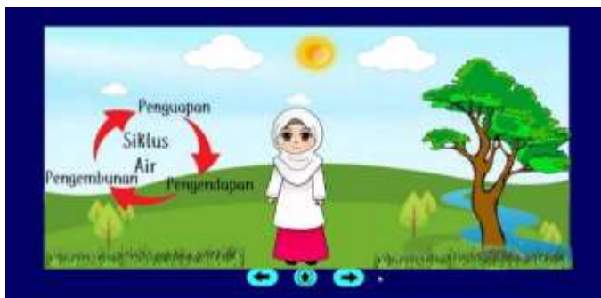
Gambar 11. Penjelasan Kesimpulan Materi

Pada bagian ini muncul animasi seorang guru, lalu menjelaskan proses terjadinya hujan setelah siklus air, yang diawali dengan munculnya gambar awan kemudian disusul tanda panah biru ke bawah lalu turun hujan, kemudian disusul dua tanda panah biru ke bawah dengan teks darat dan laut.