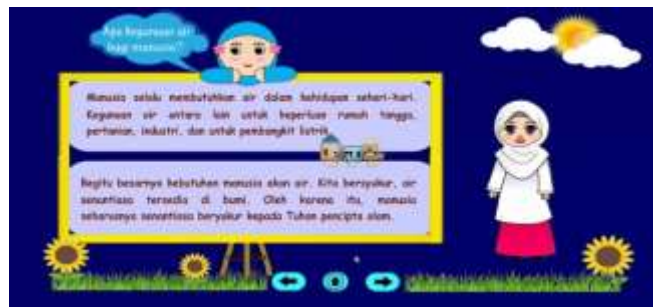
Gambar 5. Penjelasan Manfaat Air Bagi Manusia

Bagian ini diawali dengan penjelasan mengenai kegunaan air bagi manusia dengan munculnya animasi seorang guru dengan menjelaskan teks narasi yang terdapat pada media.