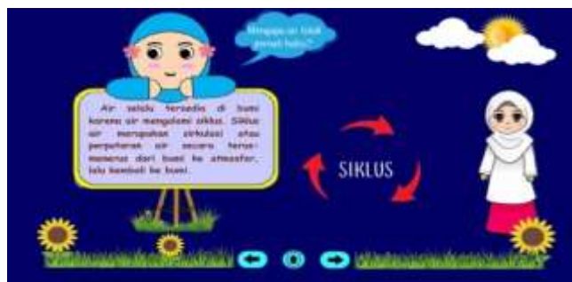
Gambar 6. Penjelasan Pengertian Siklus Air

Bagian ini diawali dengan penjelasan mengenai kegunaan air bagi manusia dengan munculnya animasi seorang guru dengan menjelaskan teks narasi yang terdapat pada media.