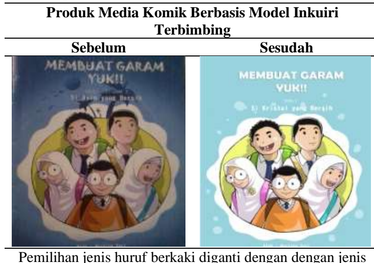
Tabel 7. Rekapitulasi Hasil Revisi dari Validator dan teman Sejawat

Berdasarkan data-data di atas yaitu hasil validasi oleh validator media, validator materi, maupun teman sejawat diperoleh hasil bahwa rekapitulasi hasil skor validasi ahli materi sebesar 93,3 % dalam kategori “Sangat Valid”, untuk hasil skor validasi ahli media yang diperoleh sebesar 97,7 % dalam kategori “Sangat Valid”, hasil skor validasi rekan sejawat sebesar 97,3 % dalam kategori “Sangat Valid”. Dengan begitu media komik berbasis model inkuiri terbimbing dapat disimpulkan memenuhi kriteria sangat valid digunakan dalam pembelajaran. Tahap kelima adalah kegiatan revisi, merupakan tahap perbaikan sesuai saran dan masukan dari validator maupun teman sejawat. Dimana terdapat beberapa indikator yang perlu diperbaiki meliputi tampilan fisik dan kemenarikan kombinasi warna yang digunakan, serta mutu gambar pada komik, yang tersaji pada Tabel 7 berikut: