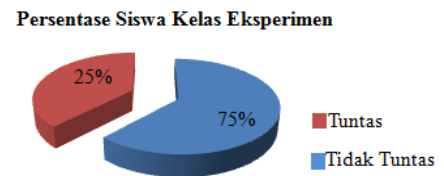
Gambar 2. Diagram Persentase Ketuntasan Siswa Kelas Eksperimen

Berdasarkan Tabel 2 di atas, terlihat bahwa persentase ketuntasan siswa kelas eksperimen lebih tinggi dari persentase ketuntasan siswa kelas kontrol. Pada kelas eksperimen, jumlah siswa yang tuntas ada 18 siswa atau 75% dan yang tidak tuntas ada 6 siswa atau 25% dari jumlah keseluruhan siswa kelas eksperimen yaitu 24 siswa. Sedangkan pada kelas kontrol 15 siswa atau 60% yang tuntas dan 10 siswa atau 40% tidak tuntas dari 25 siswa. Persentase ketuntasan kelas sampel dapat disajikan dalam bentuk diagram berikut: