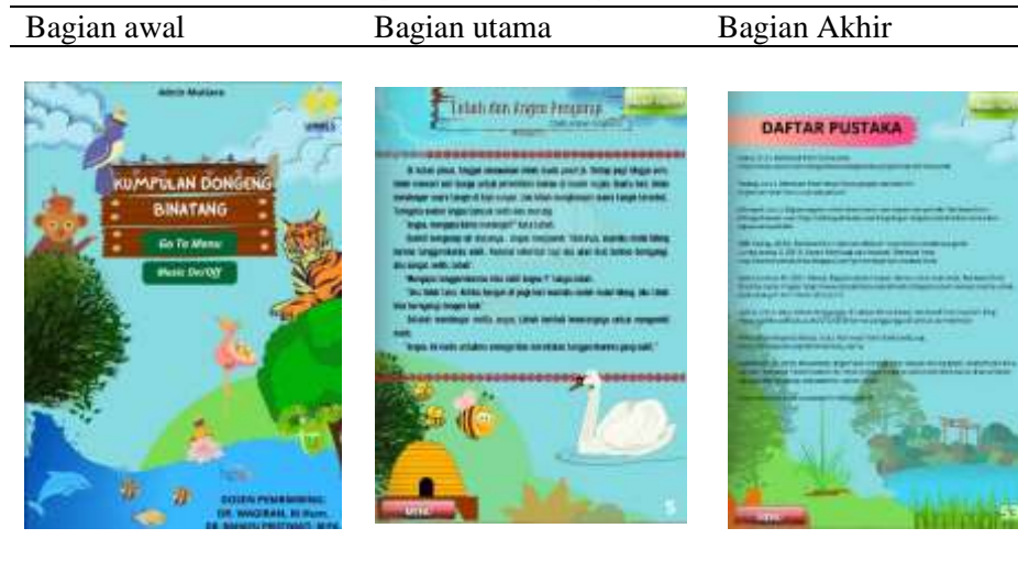
Tabel 2. Tampilan Buku Pengayaan Elektronik