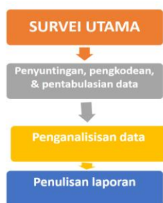
Gambar 1. Teknik Analisis Data Survei

Seluruh data yang diperoleh baik secara kuantitatif dan kualitatif menjalani 3 proses. Proses pertama yaitu seluruh data disunting, diberi kode, dan data dimasukkan ke dalam tabel. Proses kedua, data dalam tabel dianalisis. Proses ketiga, laporan hasil analisis data ditulis (Cohen dkk., 2013). Ketiga proses tersebut disajikan pada Gambar 1 di bawah ini.