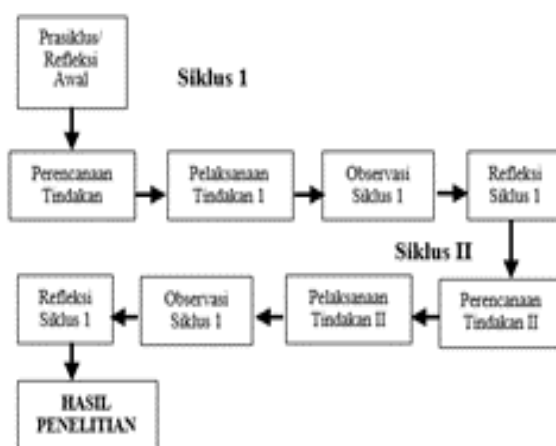
Gambar 1 Desain Penelitian Kurt Lewin (Sugiyono, 2018:43)

Penelitian ini menggunakan desain yang dikembangkan Kurt Lewin, sebagai berikut.