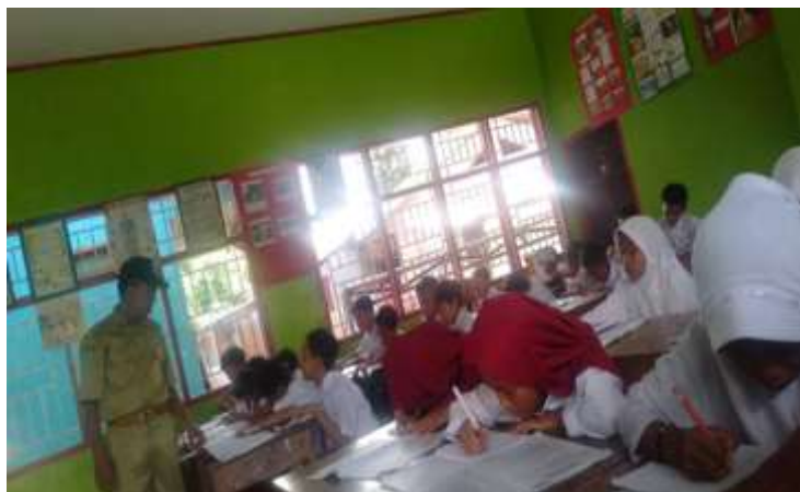
Gambar 1. Siswa mengerjakan tugas kelompok

Selanjutnya, guru bersama dengan siswa menyimpulkan pembelajaran dan mencatatnya. Setelah itu, guru memberikan tugas kepada siswa untuk dikerjakan di rumah. Kemudian, guru memberikan pesan atau motivasi kepada siswa. Pembelajaran diakhiri dengan bersama-sama guru dan siswa membaca doa dipimpin oleh ketua kelas.