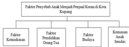
Bagan 1. Latar Belakang Anak Menjadi Penjual Koran di Kota Kupang

banyak anak penjual koran yang tidak bersekolah dikarenakan faktor kemiskinan.