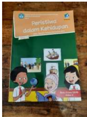
Gambar 3. Buku Tematik K13

Peneliti mendapatkan informasi bahwa siswa menyukai penggunaan media pembelajaran pada kegiatan pembelajaran dikarenakan dapat mempermudah dalam memahami suatu materi, selain itu siswa juga bersemangat ketika guru menggunakan media dalam proses pembelajaran.