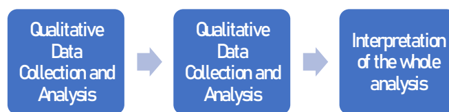
Gambar 1. Model Sequential Exploratory

Teknik pengumpulan data kualitatif dilaksanakan menggunakan wawancara, observasi tentang penerapan media pembelajaran, dan dokumentasi. Wawancara dilakukan bersama guru kelas V MI PIM Mujahidin dan hasil data didukung dengan pendekatan kuantitatif dengan teknik pengumpulan data melalui angket respon siswa sebanyak 20 siswa terhadap media pembelajaran. Angket diberikan kepada siswa secara langsung berisi 10-12 pertanyaan. Angket kebutuhan tersebut mempunyai opsi jawaban “Ya” dan “Tidak”. Tujuan dari adanya penelitian ini adalah untuk menganalisis dan untuk mencari tahu apa saja yang diperlukan siswa terhadap media yang dikembangkan oleh peneliti, yaitu media komik edukasi berbasis kearifan lokal.