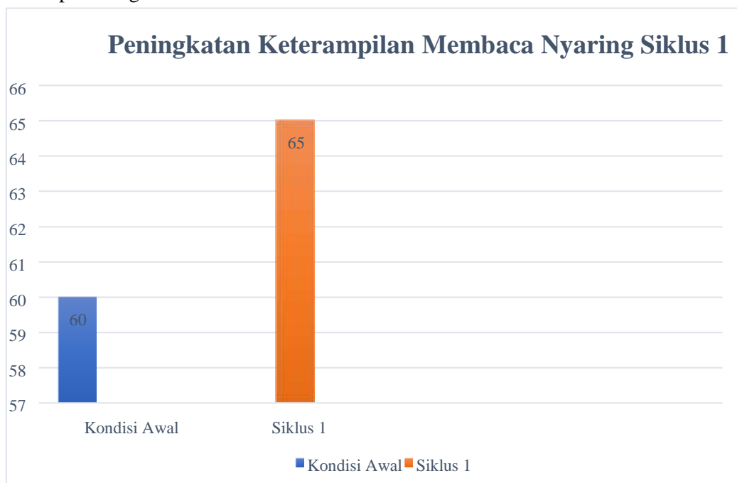
Gambar 2 Diagram Peningkatan Kemampuan Membaca Nyaring Siswa pada siklus I

Peningkatan kemampuan membaca nyaring siswa kelas II SD Negeri 2 Penusupan pada siklus I juga dapat dilihat pada diagram di bawah ini.