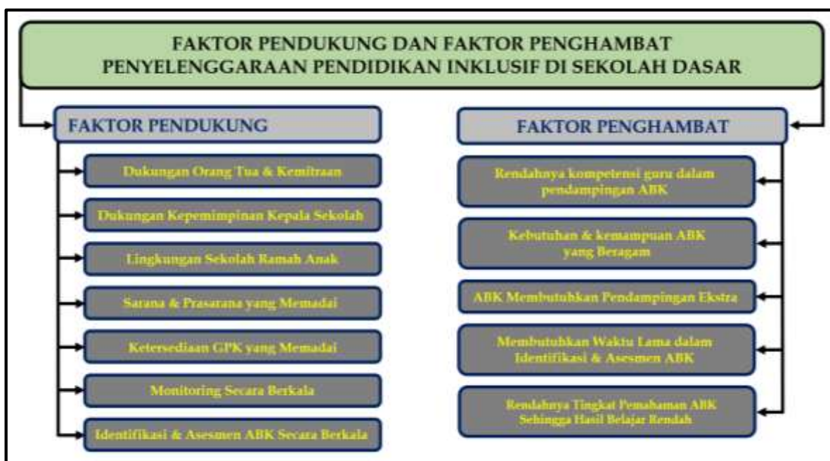
Gambar 2. Faktor Pendukung & Faktor Penghambat Penyelenggaraan Pendidikan Inklusif

Berdasarkan gambar 2, terdapat faktor pendukung dan faktor penghambat dalam penyelenggaraan pendidikan inklusif di SDN Giwangan Yogyakarta. Faktor pendukung di SDN Giwangan Yogyakarta tidak lepas dari dukungan kemitraan sekolah. Sebagaimana disampaikan oleh P4 “Dukungan dari Dinas Pendidikan, Unit Layanan Disabilitas (ULD), lembaga disabilitas dari Universitas Negeri Yogyakarta (UNY) dan orang tua sebagai mitra sekolah sangat membantu kelancaran program inklusif di sekolah”. Selain itu, kepemimpinan kepala sekolah yang selalu memberikan dukungan motivasi kepada guru. Hal tersebut sebagaimana yang disampaikan oleh P2 “Dukungan dari kepemimpinan kepala sekolah cukup baik dalam memberikan motivasi kepada guru, dukungan kepala sekolah juga membantu mencari solusi jika guru-guru mengalami kendala”. Selain itu, lingkungan sekolah di SDN Giwangan Yogyakarta juga mendukung untuk kegiatan pembelajaran inklusif. Hal tersebut sebagaimana yang disampaikan oleh P1 bahwa “Iklim sekolah yang sudah mendukung untuk kegiatan pembelajaran inklusif, karena SDN Giwangan Yogyakarta adalah sekolah ramah anak”.