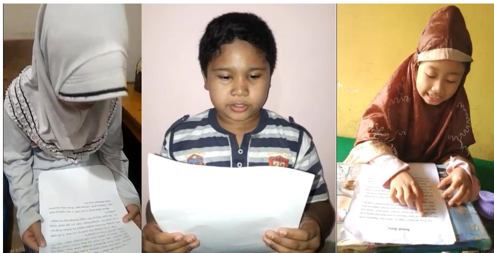
Gambar 3: Dokumentasi Anak Membaca Lancar

Pengumpulan data dilakukan dengan studi dokumentasi. Pihak sekolah bersedia memperlihatkan lembar Rencana Pelaksanaan Pembelajaran. Penilaian yang terdapat dalam Rencana Pelaksanaan Pembelajaran yang digunakan di sekolah memang menggunakan indikator kelancaran dilihat dari kemampuan anak masih terbata-bata atau tidak, membaca dengan intonasi, dan membaca dengan cepat. Berikut dokumentasi anak dalam proses membaca.