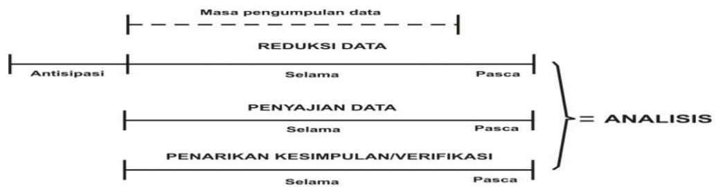
Gambar 1. Teknik Analisis Data (Salim, 2019)

Teknik pemeriksaan keabsahan data yang digunakan oleh peneliti dalam penelitian ini, sebagai berikut: Triangulasi teknik digunakan untuk menguji kredibilitas data yang dilakukan dengan cara mengecek data kepada sumber yang sama dengan cara yang berbeda, misalnya peneliti sudah melakukan wawancara, data yang didapatkan melalui wawancara lalu dicek lagi dengan observasi secara langsung, kemudian melakukan dokumentasi. Meningkatkan ketekunan berarti melakukan pengamatan secara lebih cermat dan berkesinambungan, dengan cara tersebut maka kepastian data yang sudah didapatkan oleh peneliti dan urutan peristiwa akan direkam secara pasti dan sistematis. Bahan referensi disini adalah dengan adanya bukti pendukung untuk memperkuat dan membuktikan data yang sudah ditemukan di lapangan penelitian (Sugiyono, 2018).